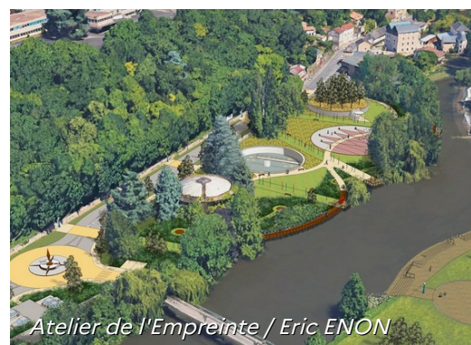
Atelier de l'Empreinte / Eric ENON

Le site se termine à l'entrée du lieu-dit « le moulin à parant » sur une ex station-service transformée en magasins avec parking et enseignes.